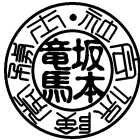
(外)篆書体 (内)古印体